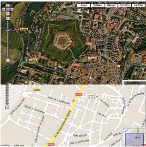
Figura 5. Distintas opciones de visualización cartográfica de un bien cultural aplicadas a la Ciudadela de Jaca

facier de una forma flexible las necesidades de un amplio abanico de usuarios particulares y profesionales. De este modo, por ejemplo, en el caso de los edificios cada ficha incluye información referente a su localización georreferenciada, entorno, descripción, datos históricos, estado de conservación, intervenciones, información etnográfica o cultural (leyendas, romerías, etc.), horarios de visita y datos de contacto, historial