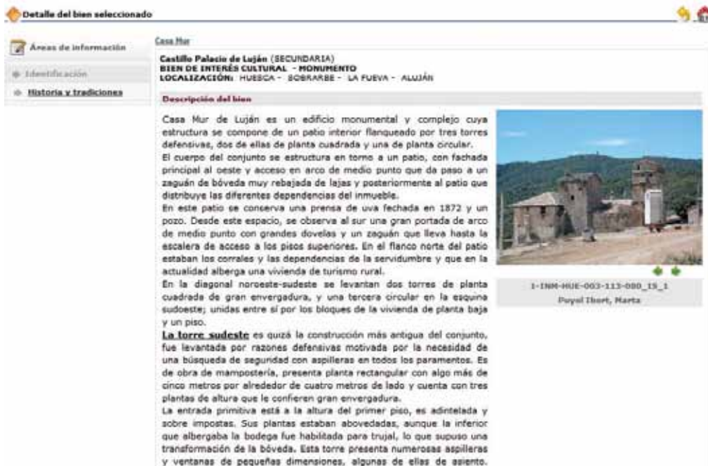
Figura 4. Ficha de un bien cultural: pantalla con datos descriptivos