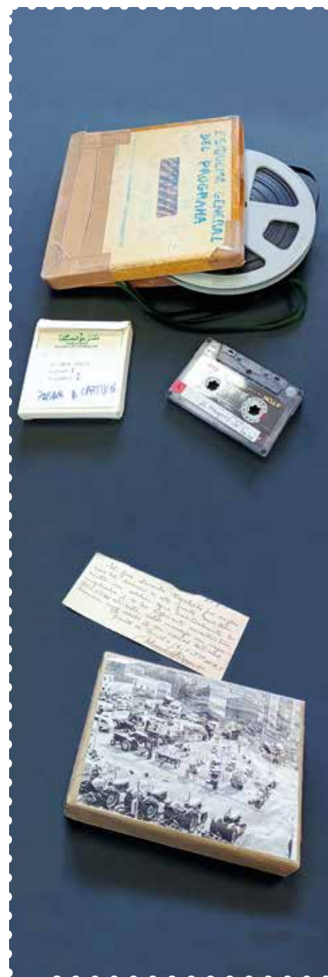
Cintas y cassettes de Radio Juventud de Barbastro. Cliché de anuncios de prensa.