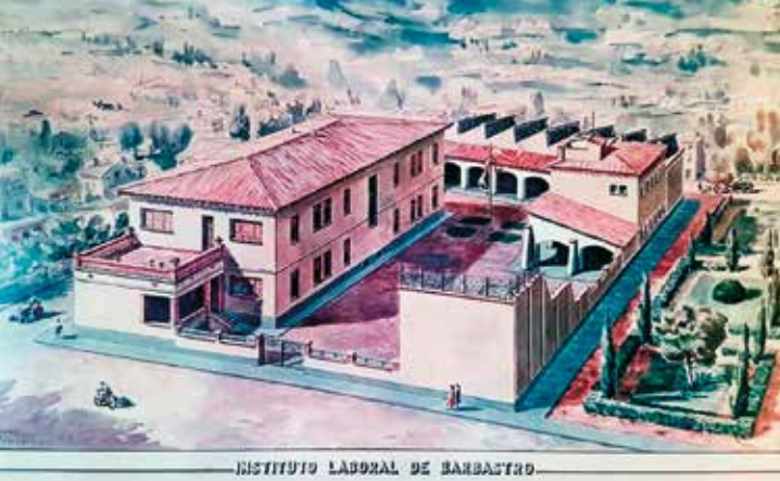
INSTITUTO LABORAL DE BARBASTRO

Proyecto del Instituto Laboral en el Instituto de 2ª Enseñanza.