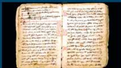
Privilegios medievales concedidos a la Villa de Teruel