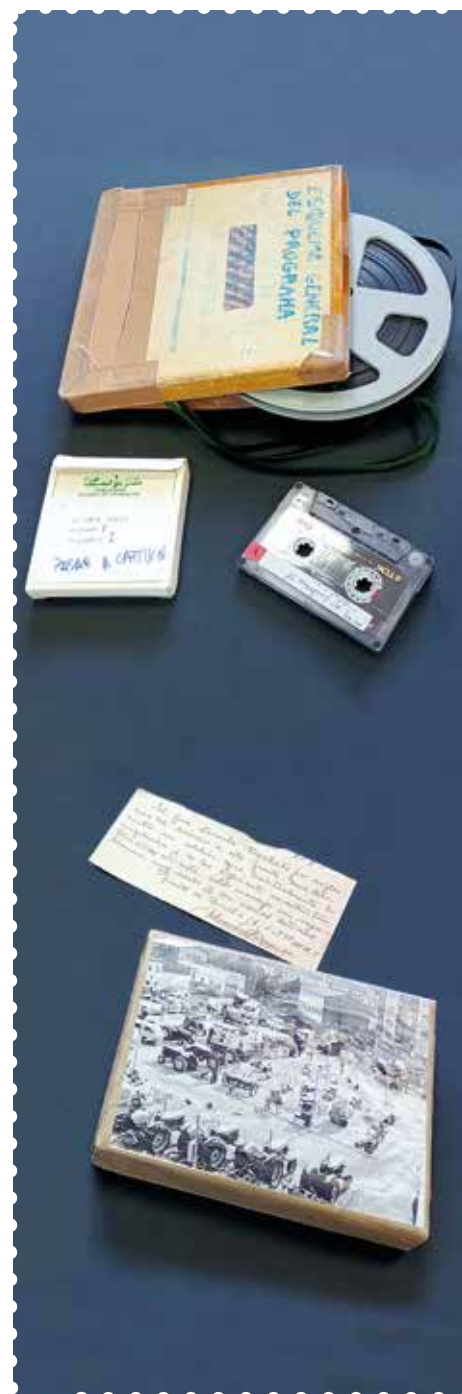
Cintas y cassettes de Radio Juventud de Barbastro. Cliché de anuncios de prensa.