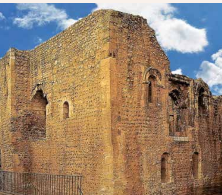
Torreón de doña Berenguela. (León).

A l jubilarme, después de una vida profesional dedicada al mundo financiero, donde los números y la inmediatez marcaban el ritmo, tuve por fin la libertad de adentrarme en una pasión que siempre me había acompañado, la historia.