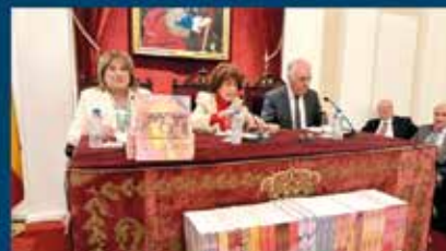
Publicación de Actas de las Cortes de Aragón