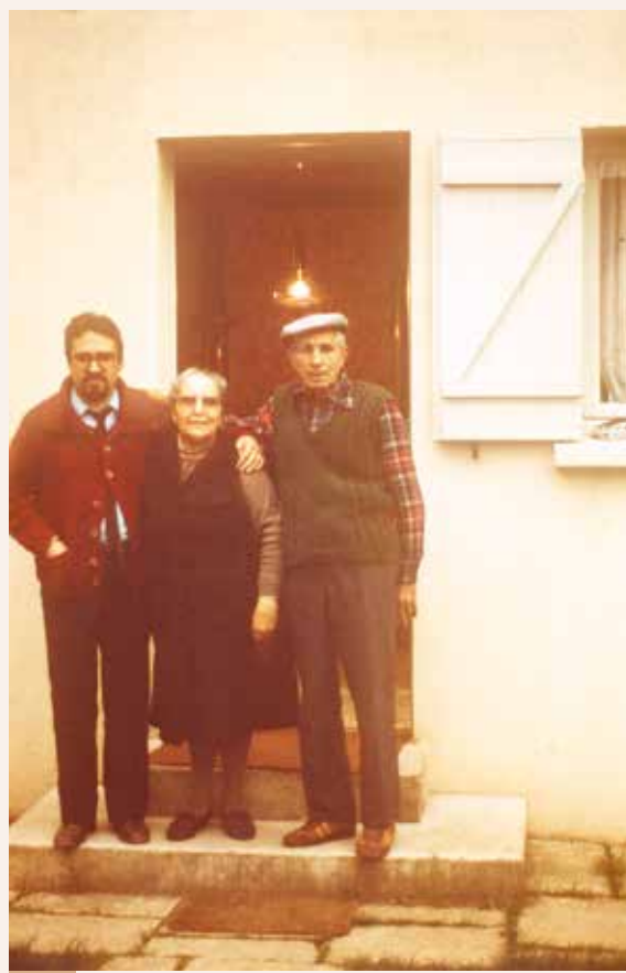
Región de París, hacia 1982

En estos meses la violencia revolucionaria fue despiadada, especialmente con los representantes de la Iglesia, y conllevó la destrucción de un riquísimo patrimonio artístico y documental de la ciudad y su comarca.