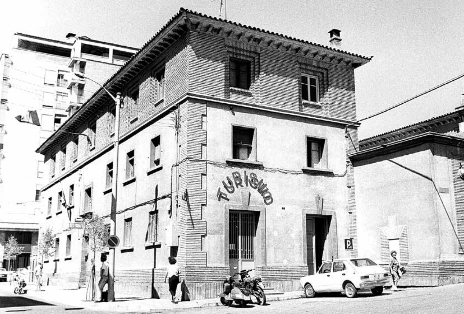
Estación de autobuses y Oficina municipal de turismo de Barbastro (1975).