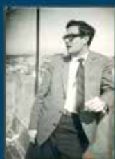
Publicado el portal monográfico de Anchel Cente